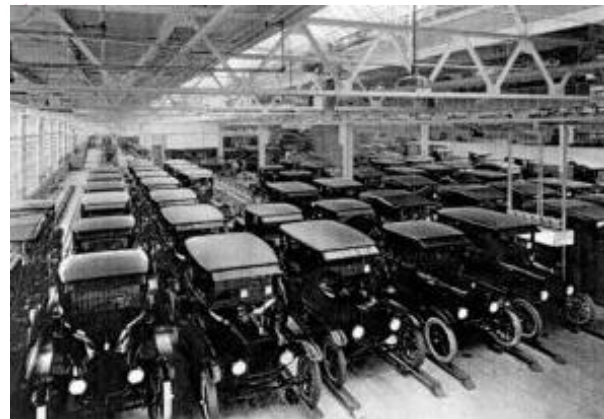
Beeldfragment 20-01: Een kantelend tijdperk