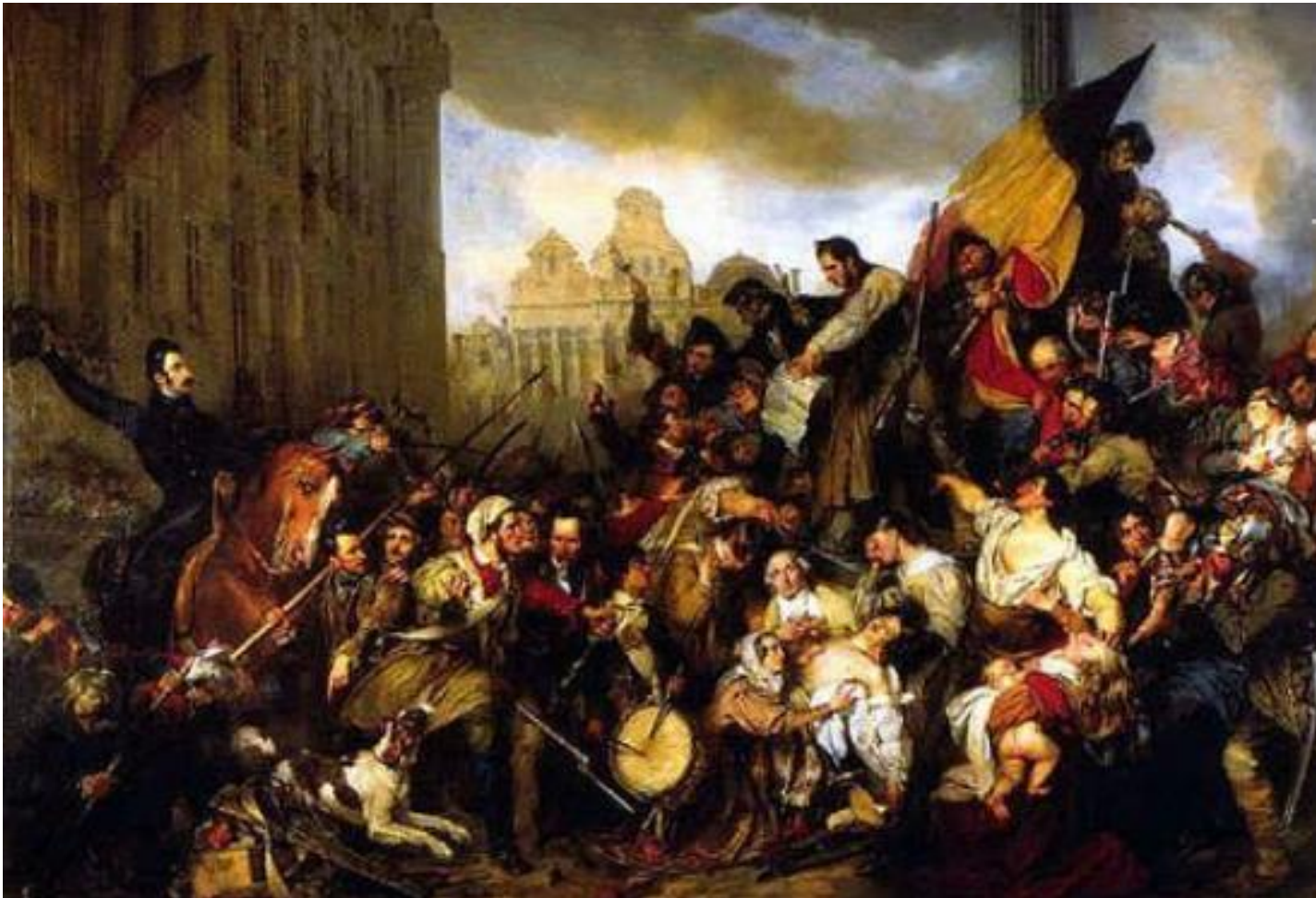
Beeldfragment 08-01: Nederlandse reportage over België en Vlaanderen