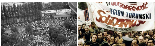
Beeldfragment 12-12: Solidarnosc (Solidariteit)