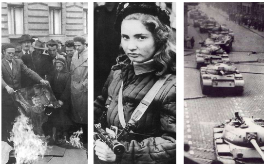
Beeldfragment 12-10: De Hongaarse revolutie (Boedapest, 1956)