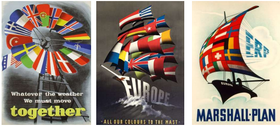
Beeldfragment 12-01: Marshall plan