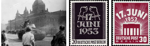
Beeldfragment 12-09: De arbeidersopstand in Oost-Berlijn (1953)