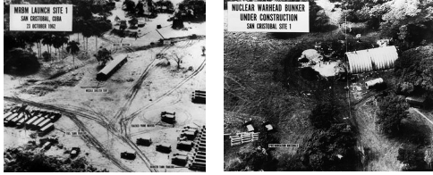
Beeldfragment 12-05: Traller: Thirteen days

- anti-rakettenbetogingen in de jaren '80