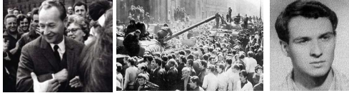
Beeldfragment 12-11: De Praagse Lente (Tsjecho-Slowakije, 1968)