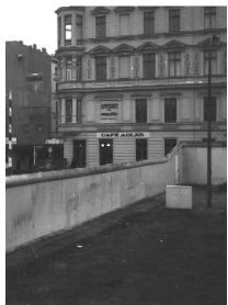
Beeldfragment 11-04: Berlijnse muur 2