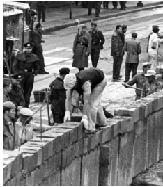
Beeldfragment 11-03: Berlijnse muur 1